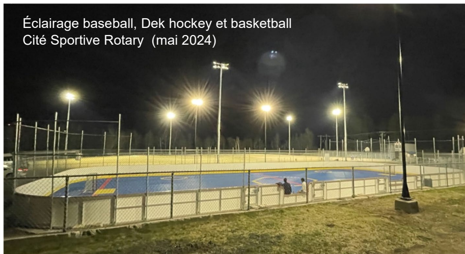
Éclairage baseball, Dek hockey et basketball Cité Sportive Rotary (mai 2024)